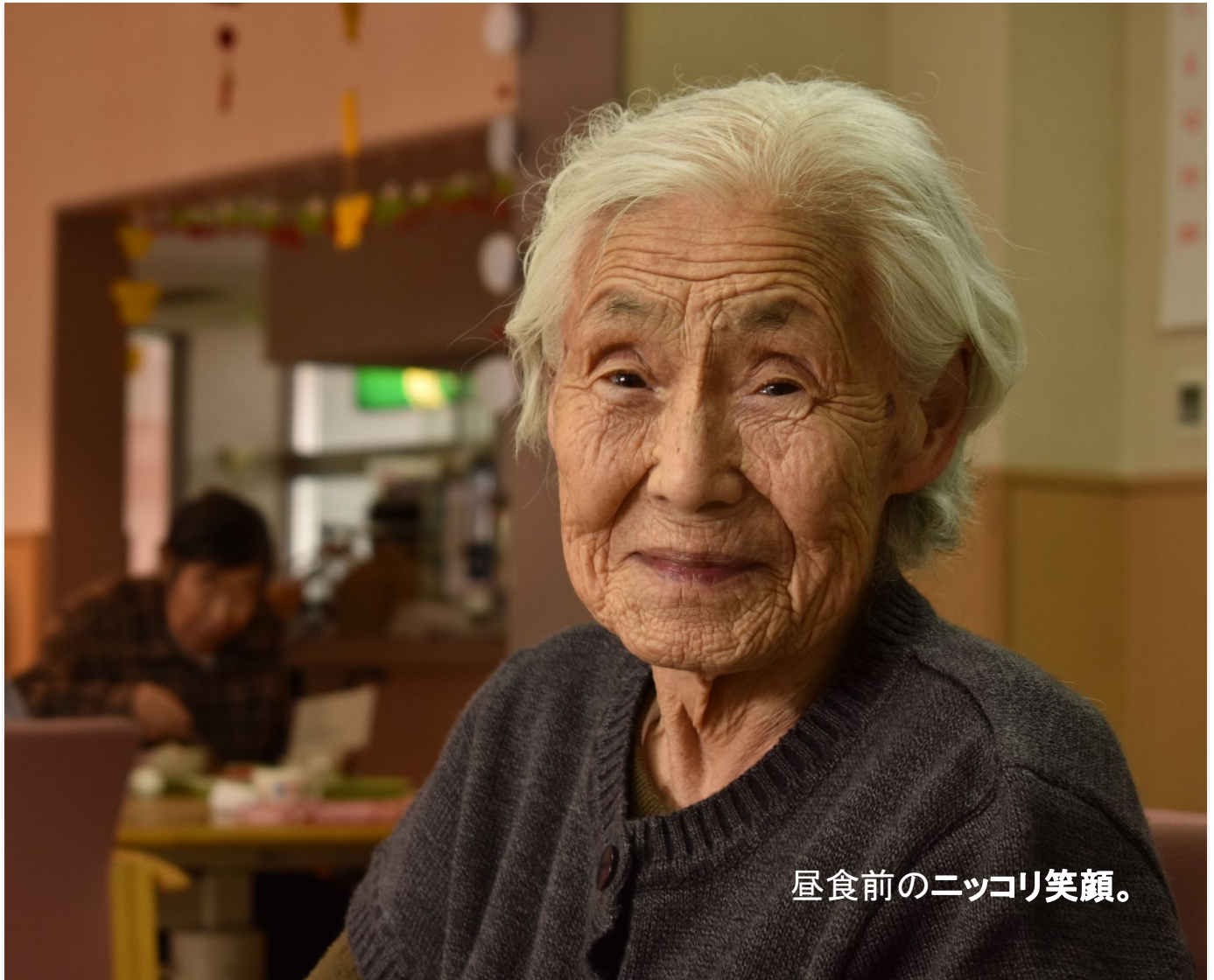
昼食前のニッコリ笑顔。